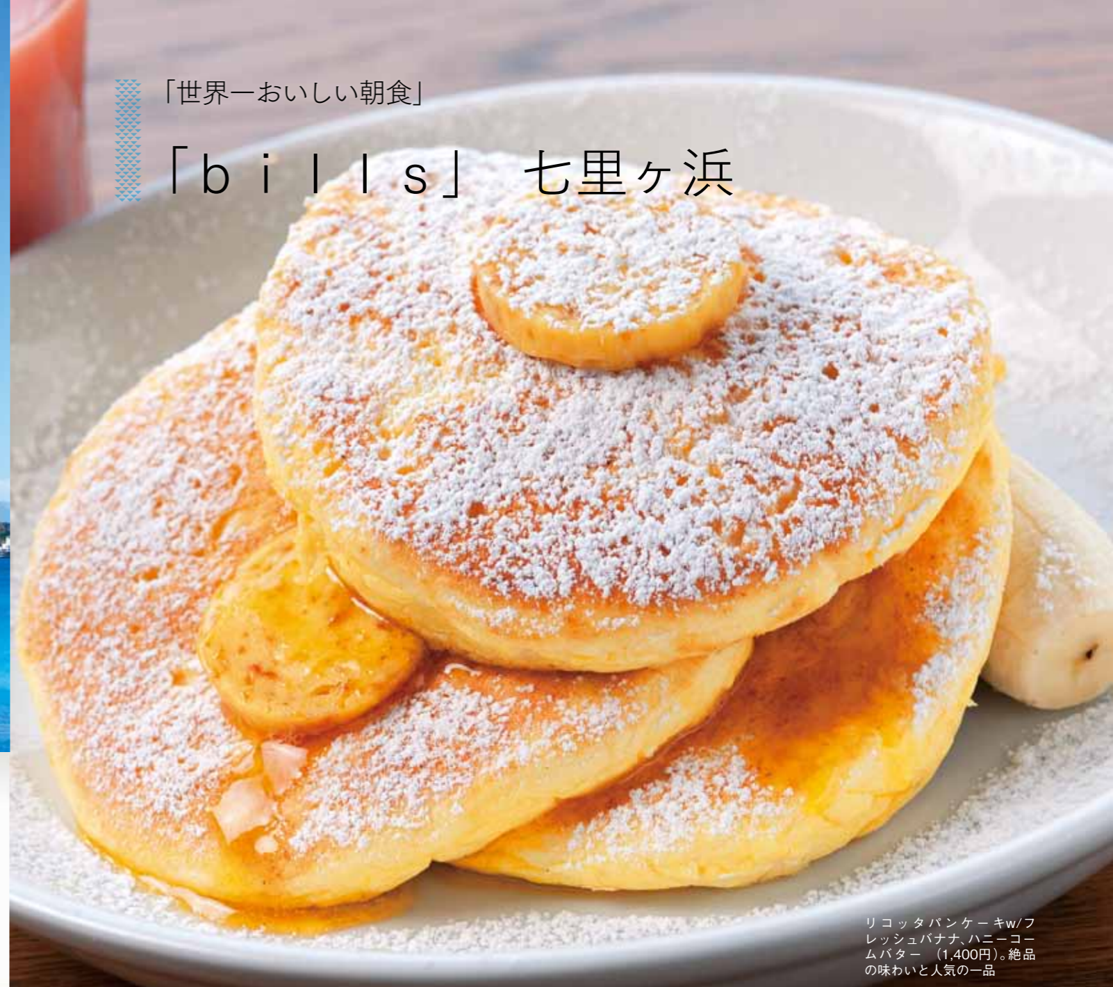
リコッタパンケーキw/フレッシュバナナ、ハニーコムバター (1,400円)。絶品の味わいと人気の一品