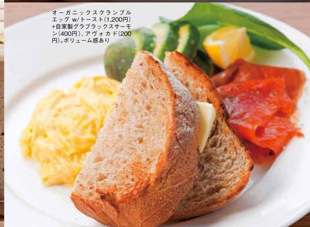
オーガニックスクランブルエッグ w/トースト(1,200円)+自家製グラブラックサーモン(400円)、アヴォカド(200円)。ボリューム感あり

七里ヶ浜の海から照り返す光が揺れるbillsのテーブル。家庭の食卓をイメージしたカジュアルなデザインと、デザイン性に富むインテリアで統一された落ち着いたラウンジ。シンプルでありながら他では味わえない、独創的な食事が楽しめます。